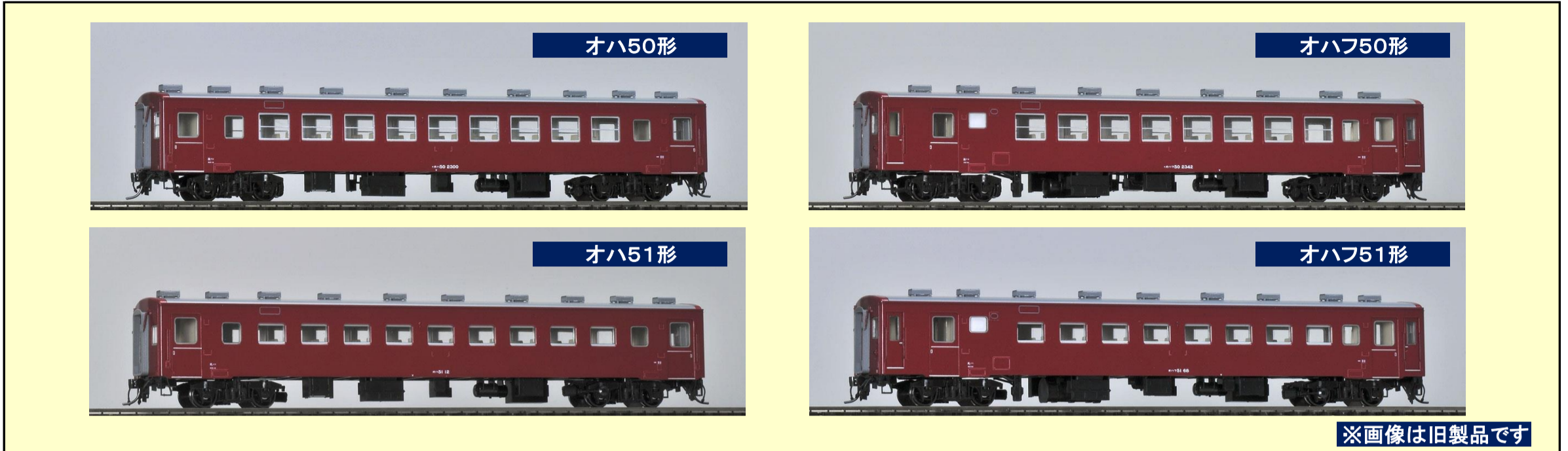
※画像は旧製品です