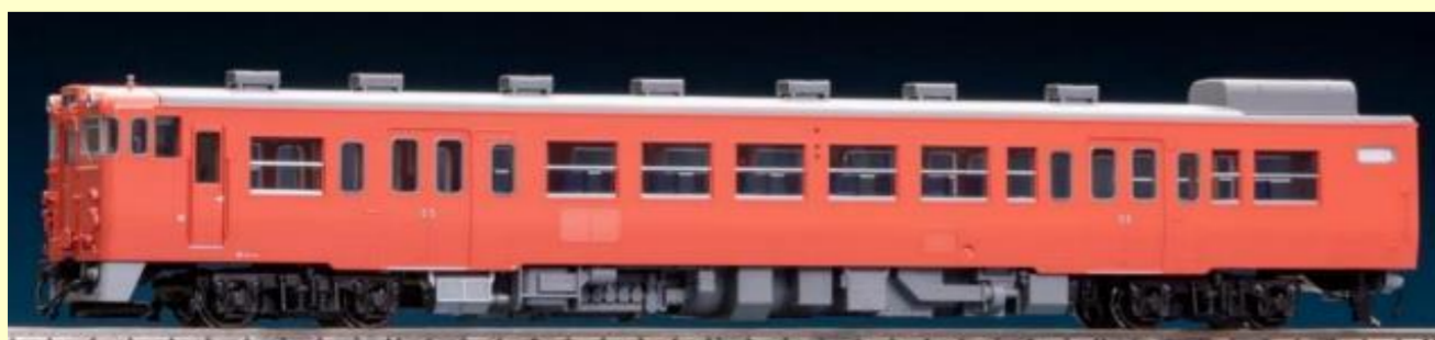
キハ47形ディーゼルカー首都圏色