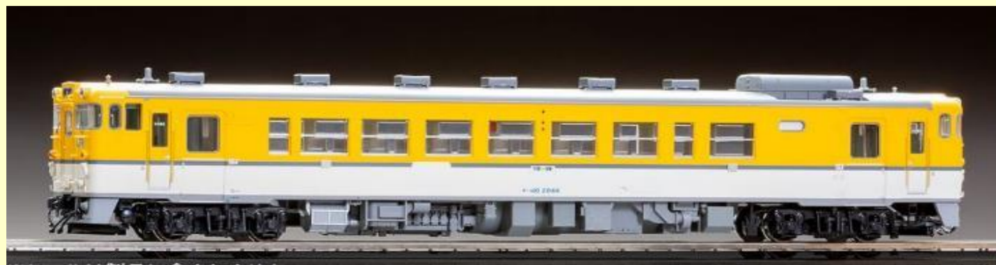
キハ40 2000形ディーゼルカー広島色