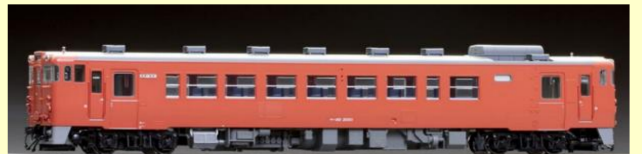
キハ40 2000形ディーゼルカー首都圏色